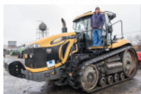
Cat Challenger Tractor