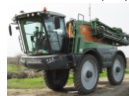
Amazona Pantera Sprayer