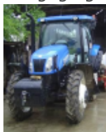
New Holland Tractor