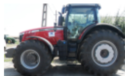
Massey Ferguson Tractor