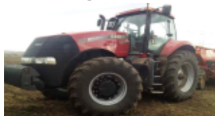
Case Magnum Tractor