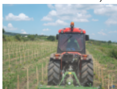
Goldoni Star Tractor