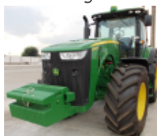
John Deere Tractor